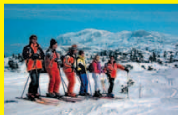
Geführte Gruppen verleihen Sicherheit

Vor allem nach starken Schneefällen und großer Windverfrachtung herrscht akute Lawinengefahr. Vor allem die steilen Abfahrten nach Süden in die Ramsau sind dann unpassierbar. Erkundigen Sie sich deshalb vor Antritt der Tour über die aktuelle Lawinengefahr.