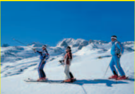
Tauchen Sie ein in das Panorama des Dachsteins.

Tour S1 Um sich für die Steilabfahrten fit zu machen, findet man in unmittelbarer Nähe des Schladminger Doppel-Schlepplif­tes das perfekte Übungsgelände. Tourenbeschreibung für die Übungstour: Von der Bergstation des Schladminger Doppel-Schlepplif­tes fährt man links der Lif­trasse zum Gjaidstein-Sattel mit der kleinen Bergrettungs-Hütte. Über den flachen Felsgrad des kleinen Gjaidsteins steigt man einige Minuten bergauf, bis eine Einfahrt in die steile (45 Grad = 100%) Südostflanke möglich ist. Der zirka 300 Meter lange Steilhang endet direkt an der Talstation des Schladminger Doppel-Schlepplif­tes. Hier kann jeder sein Steilwandkönnen testen, ehe man sich in die gefährlichen Steilwände wagt.