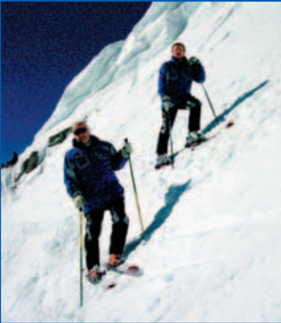
45 Grad (100%) Hang­neigung macht die Abfahrt zum Erlebnis

Voraussetzungen: Sicheres Beherrschen der Ski, auch in steilerem Gelände (bis 45 Grad Hang­neigung). Je nach Schnee-Beschaffenheit variieren die Schwierig­keiten. Was bei g’führigem Firn ein Kinderspiel ist, kann bei Harsch zur echten Herausforderung werden. Also – vor der Tour unbedingt Erkundigungen einho­len! Touren-Neulinge sollten sich einem Führer anver­trauen!