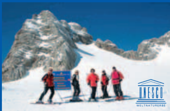
König Dachstein wartet auf Sie!

werden. Vom Eisstein geht es über die mittlere Zunge des Hallstätter Gletschers direkt hinunter zum oberen Eissee. Von hier muss man ca. 200 Höhenmeter zur Simonyhütte aufsteigen. Freie, sanfte Gletscherhänge führen hinab zur Simonyhütte (2.203 m).