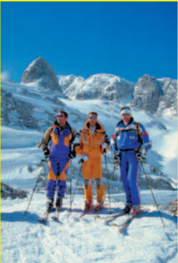
Der Dachstein - ein besonderes Erlebnis!

Liebhavern extremer Ski- und Snowboard-Abfahrten bieten die Südfanken des Dachsteingebirges ein wahres Eldorado. Durch die Dachstein-Gletscher-Bahn lässt sich bequem ein Höhenunterschied von 1000 Metern überwinden. Die Ausgangspunkte der einzelnen Touren erreicht man (durch Querungen) von der Bergstation.