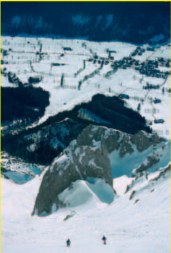
Fluderrinne, S3, Tiefblick in die Ramsau