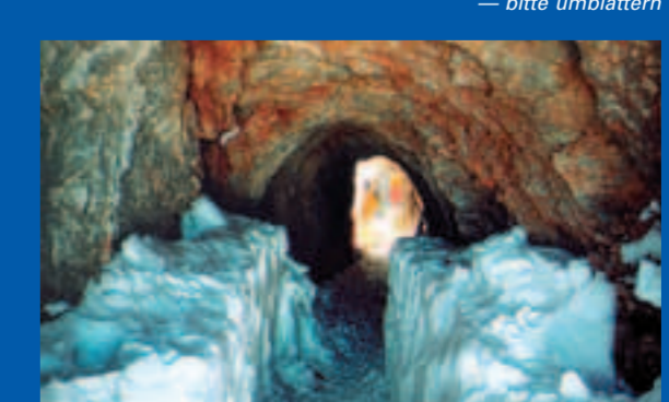
Rosmarie-Stollen zur Einfahrt Edelgrieß.

Tour 2 Darf's a bissel' steiler sein? 1.600 Höhenmeter Tiefschneegenuß in grandioser Felskulisse, Richtung Süden, zur Ramsau, bildet das Dachsteingebirge steile Felsbarrieren. Zwi-