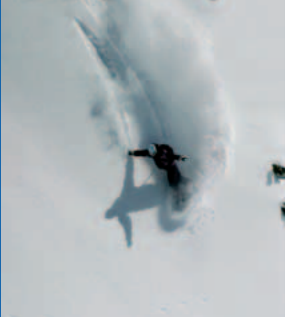
Erlebnis Skitouren am Dachstein