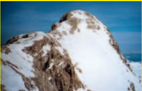
Steilwandtraining: Südostflanke Kleiner Gjaidstein, S1

Die im folgenden beschriebenen Steilabfahrten sind ausschließlich für extrem versierte und bergerfahrene Tourengeher. Die Steilpassagen der Abfahrten weisen Neigungswinkel von 45 Grad (= 100% Gefälle!) und mehr auf, d. h. ein Sturz kann unter Umständen nicht mehr korrigiert werden und führt zum Absturz. Anforderungsprofil: Exzellente Beherrschung des Sportgerätes in jeder Situation, Bergerfahrung, perfekte Ausrüstung (z. B.: Bindung darf sich nicht zu leicht öffnen), absolute Trittsicherheit, Schwindelfreiheit und starke Nerven. Mut ist hier unbedingte Voraussetzung. Übermut aber völlig fehl am Platz. Um das richtige Einschätzungsvermögen und das Gefühl für steiles Gelände zu bekommen, sollte man sich zuerst unbedingt an der extrem steilen, aber relativ sicheren Abfahrt vom Kleinen Gjaidstein zum Schladminger Gletscher versuchen. Wer sich hier in die Hose macht, sollte sich in die anderen Steilwandabfahrten nicht hineinwagen!