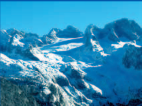
Perspektive nach Abfahrt Gosau

Tour 6 Hochalpin! Eine klassische Skitour für Alpinisten. Kenner bewerten die Skitour vom Dachstein nach Gosau als eine der schönsten der Alpen.