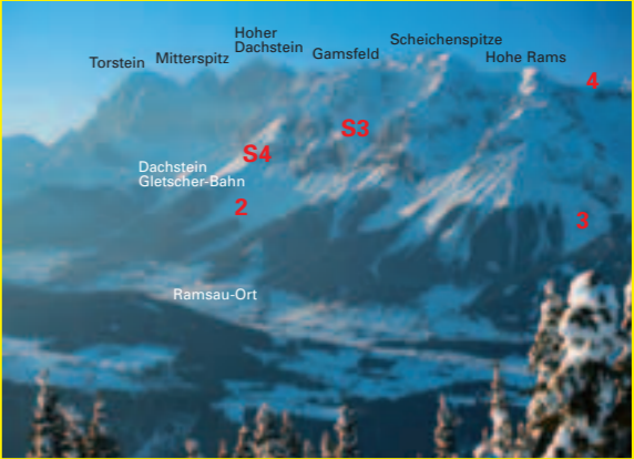
Tourenabfahrten in die vordere Ramsau

Tourenbeschreibung: Von der Bergstation durch den Rosmariestollen zur Einfahrt Edelgriß. Von hier bieten sich 2 Varianten: a) Von hier unmittelbar hinab durch das steile Coloir (45 Grad) oder