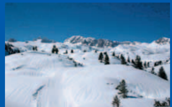
Die National-Skitour – Tanz am weißen Parkett

Variante: Als Variante kann die Spur vom Dirndlkolk hinunter zur unteren Felsnase des Eissteins gewählt