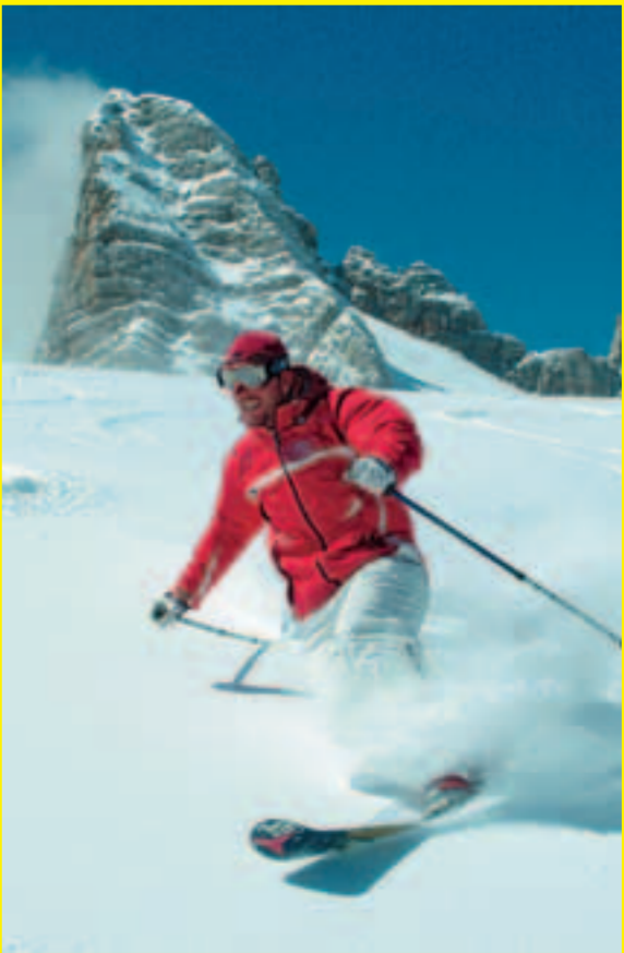
Der Dachstein – Österreichs Touren Eldorado

Tour S4 Die 1 km breite Südwestflanke des Gamsfeldspitz ist eine Genusstour für Fortgeschrittene. Hangneigung bis 45° Tourenbeschreibung: Zugang wie Tour S3. Von der Fluderscharte (2.600 m) nach rechts haltend, in die weiten Steilflanken des Gamsfelds. Durch das enge Gamsfeldgassl und die Kraml-Lahn hinab nach Ramsau – Brückenhof (Linienbus).