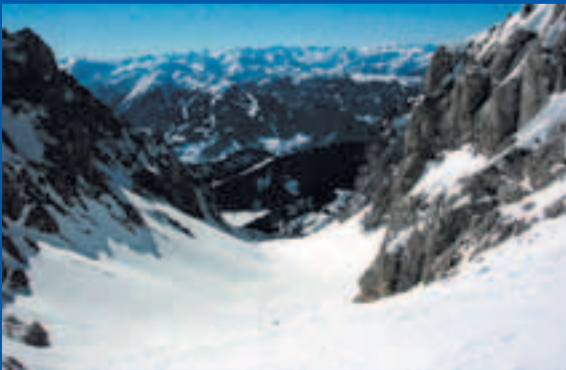
Blick ins Edelgriß

Tour 2a Westlich , über die weiten Hänge des Burgstalls hinab in den Karboden. Kurze Querung zur Tür­lwandhütte und zurück zur Talstation der Gletscherbahn.