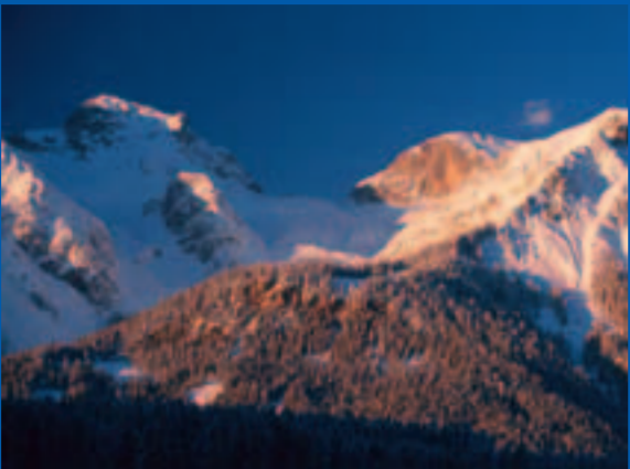
Gruberscharte (links), Guttenberghaus (Bildmitte)

Tour 3 Die klassische Tour über den Stein. Beliebte Übergangstour der Einheimischen. Führt über den Schladminger-Gletscher und die einsame Karsthochfläche »Am Stein« zum Guttenberghaus (unter der Feisterscharte). Ab hier eine herrliche Firnabfahrt bis auf das Sonnenplateau der Ramsau. Technisch relativ einfach, aber Bergerfahrung und Orientierungssinn erforderlich!